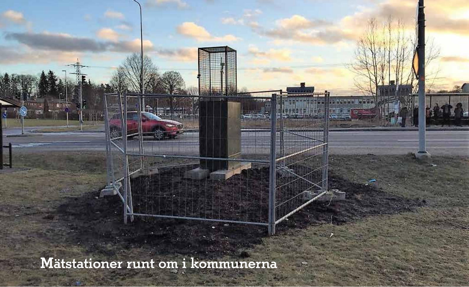
Mätstationer runt om i kommunerna