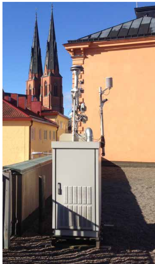
Mätstation med luftinsug som används för mätning av olika typer luftföroreningar.

De uppmätta årsmedelvärdena för kvävedioxid i bakgrundsluft i regionen ligger mellan 3 och 20 mikrogram per kubikmeter ( \mu\text{g}/\text{m}^3 ) luft. I gatunivå ligger medelvärdena för både timme, dygn och år över normvärdet på många innerstadsgator. Även längs vissa stora trafikleder ligger halterna nära normvärdena. Halterna är svåra att beräkna men kan i vissa fall ligga nära skadliga nivåer. Halterna av ozon är